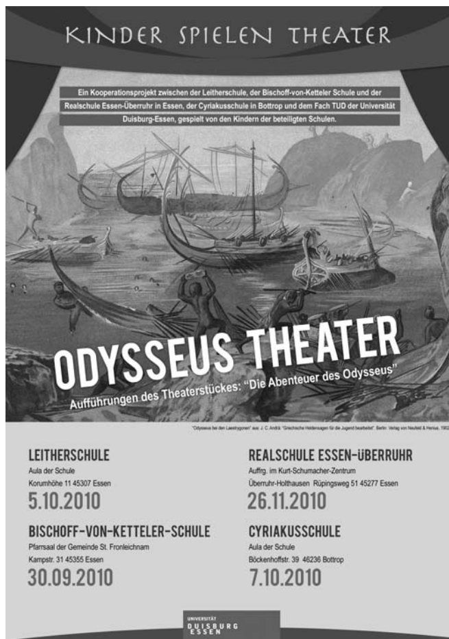
Abb. 6 Plakat zu den Odysseus Theateraufführungen

begleitende Unterricht in den verschiedenen Klassen durchgeführt worden ist.