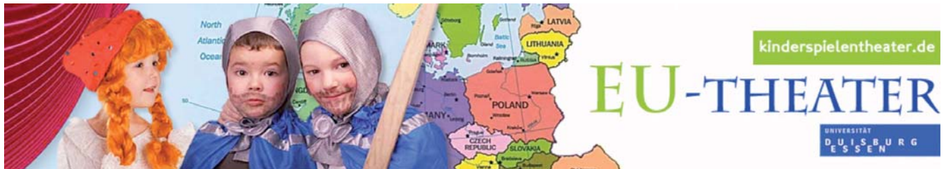
Abb. 1 Header der Webseite des „Europa Theater“ Projekts