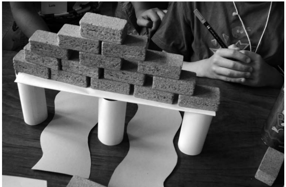
Abb. 8 Bau von Türmen in Versetzbauweise

/13/. Die Kinder experimentierten mit Sonnenuhren, Kerzenuhren, Wasseruhren und beschäftigten sich mit dem Aufbau von mechanischen Uhren (Abb. 9 und 10). Dabei erkannten sie die Nachteile von Kerzen-, Sonnen- und Wasseruhren, und warum die Erfindung der mechanischen Uhr im mittelalterlichen Europa ein großer Fortschritt war.