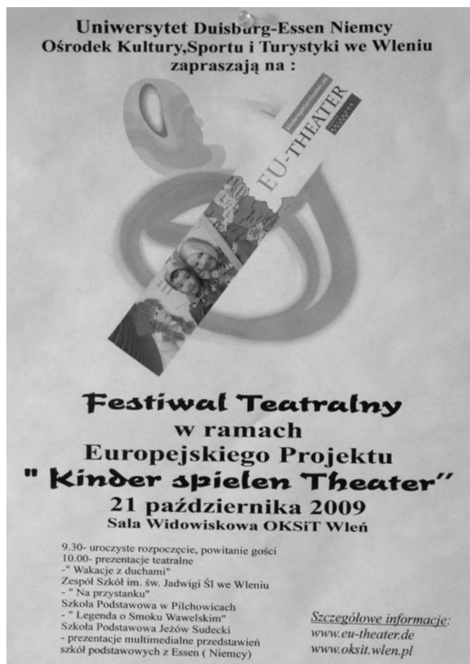
Abb. 3 Plakat zum Europa Theatertag in Essen

► „Eulenspiegel macht den Händlern einen Vorschlag“ und „Eulenspiegel malt ein Bild“ (Leitherschule in Essen, mit zwei Klassen, jeweils 2. Schuljahr) /9/.