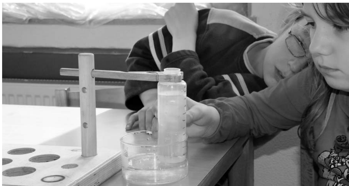
Abb. 10 Erprobung einer Wasseruhr

Jede der bisher erprobten Umsetzungsvarianten ermöglichte das erfolgreiche Anbahnen eines Europa-Verständnisses bei den Kindern, sodass nicht immer alle Europa relevanten Inhalte im Unterricht behandelt werden mussten. Dies ist für die Praxis besonders bedeutsam, denn Lehrkräfte haben somit die Möglichkeit, unter den verschiedenen Varianten zu wählen und können ihren Unterricht zum Thema „Europa“ unterschiedlichen Rahmenbedingungen und Situationen anpassen. Auch die Flexibilität bei der Wahl der Themen, die sich beim Einsatz dieser Methode für den begleitenden Unterricht ergibt, wurde ebenfalls positiv bewertet, zusätzliche Umsetzungsvarianten können gefunden werden.