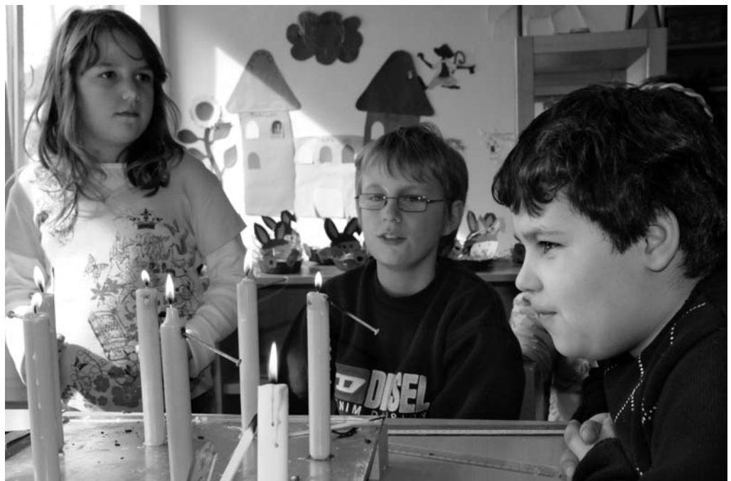
Abb. 9 Erprobung einer Kerzenuhr

Als erstes konnten wir feststellen, dass das „Theater Spielen mit Kindern“ sich in allen Phasen als sehr gut geeignet zum Herantragen des Themas an die Kinder erwiesen hat. Die ausgewählten Theaterstücke waren dafür sehr gut geeignet.