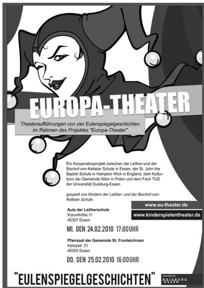
Abb. 5 Europa Theater/Eulenspiegelgeschichten