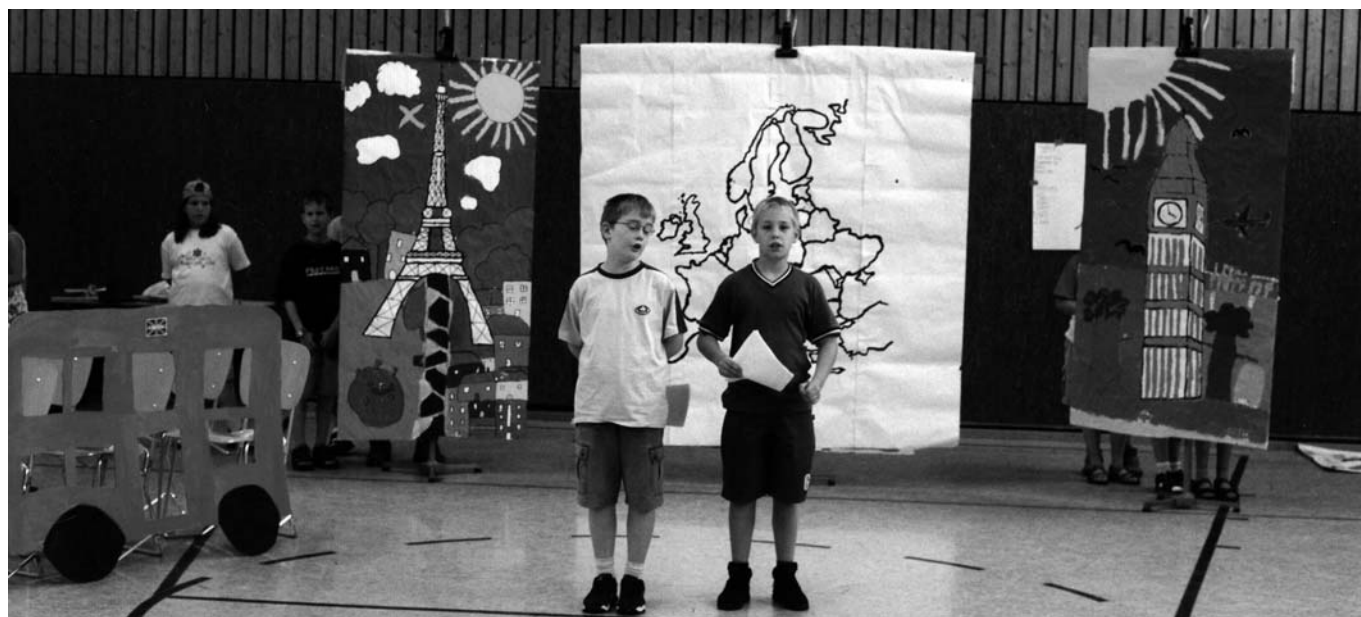
Abb. 2 Szene aus dem Theaterstück „Ich komme aus ...“

ten Inhalte angesprochen werden. Unter den Theaterstücken, die im Rahmen des Projekts „Kinder spielen Theater“ entwickelt wurden, boten sich eine Reihe davon für die Inhaltsbereiche 1., 2., 5. und zum Teil auch für 3. an (siehe /1/). Für die unter 4. genannten Inhalte waren bis dahin nur Stücke für Schulen in Deutschland entwickelt worden. Um aber auch aktuelle Themen aus anderen europäischen Ländern einbeziehen zu können, war es also notwendig, Schulen außerhalb Deutschlands für die Teilnahme zu gewinnen.