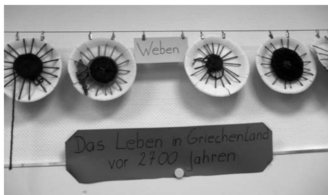
Abb. 11 Leben im antiken Griechenland

Für interessierte Lehrerinnen und Lehrer weisen wir darauf hin, dass die Fortführung unseres Projekts auch weiterhin auf der Webseite dokumentiert werden wird.