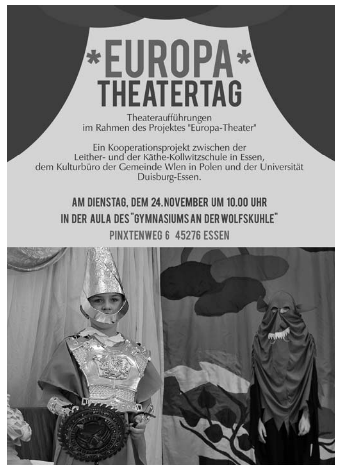
Abb. 4 Plakat zum Europa Theatertag in Polen

Im Folgenden werden einige Beispiele vorgestellt, die zeigen, mit welchen jeweils unterschiedlichen Zielsetzungen der